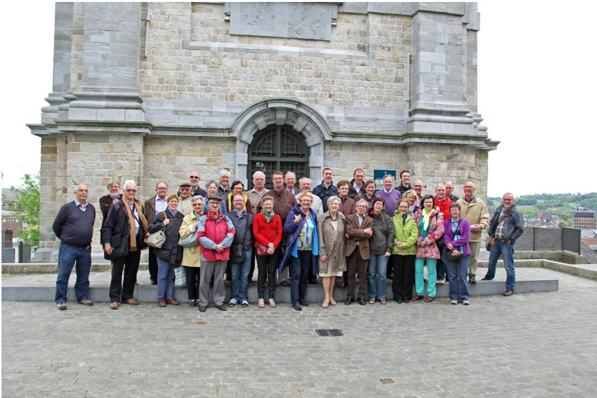
Groepsfoto van de deelnemers aan de ledenuitstap in Mons.

De ledenuitstap op 26 april bracht ons naar Mons en Lessines. In Mons werden o.a. het stadhuis, de collegiale kerk Sainte-Waudru, de Nicolaskerk en het belfort bezocht. In Lessines werden we rondgeleid in het Hôpital Notre Dame à la Rose. 37 leden nam deel aan deze geslaagde uitstap, waarvan de organisatie in handen was van bestuurslid Herbert Smitz.