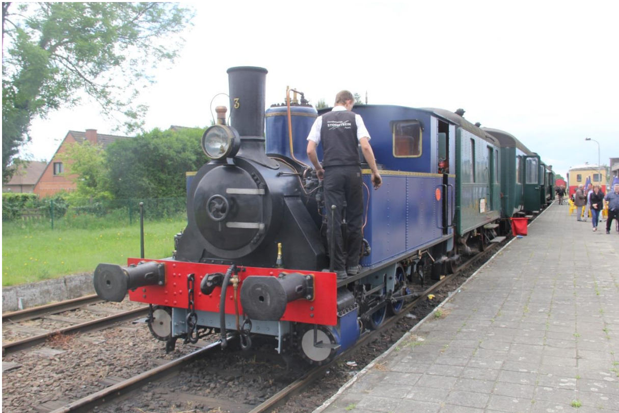
Inhuldigingsrit van de gerestaureerde stoomlocomotief te Baasrode.

toeristische lijn 52 tussen Baasrode en Puurs (14 km). In Het Nieuwsblad van 17 mei verscheen een artikel over de gerestaureerde locomotief.