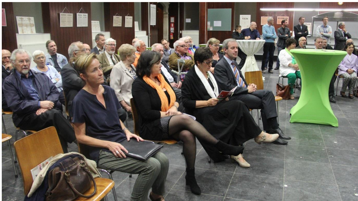
Opening tentoonstelling WOI gelezen in zijn affiches in Calfac, Sint-Jozef-Klein-Seminarie.