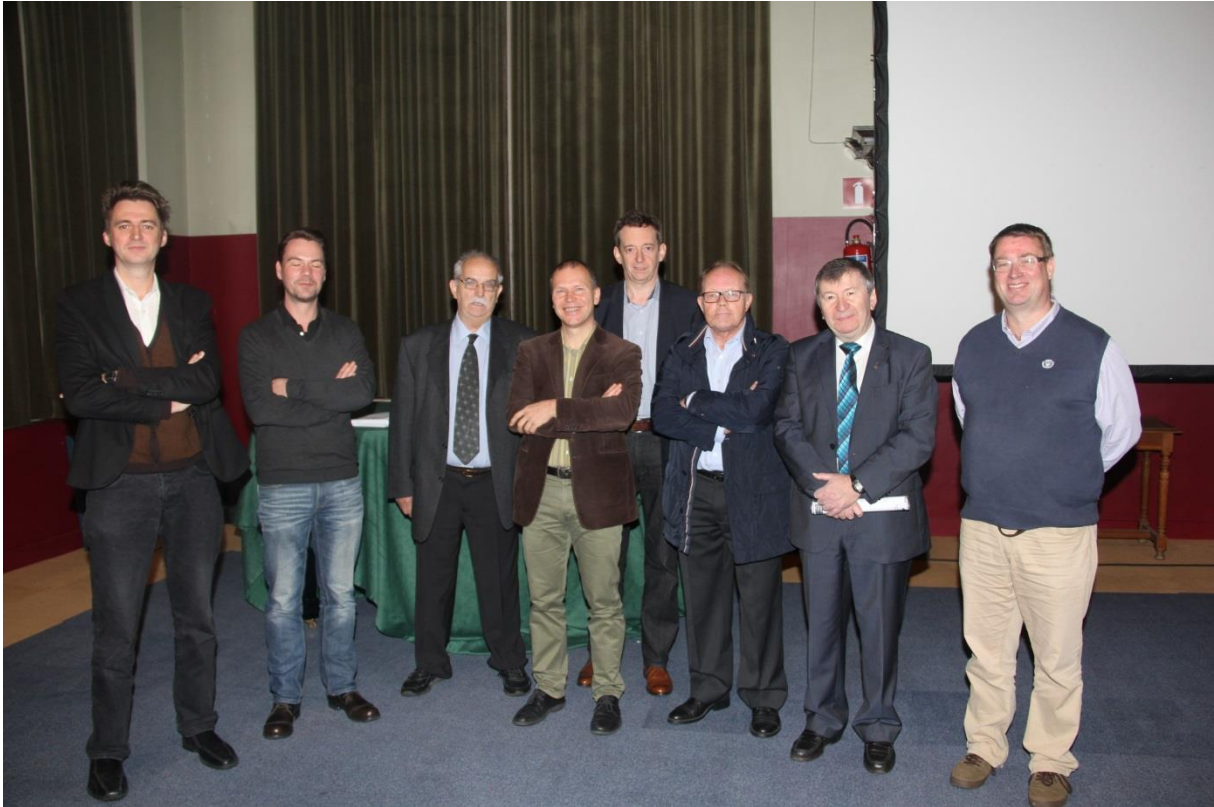
Voorstelling Annalen (deel 117) gemeentehuis Temse.